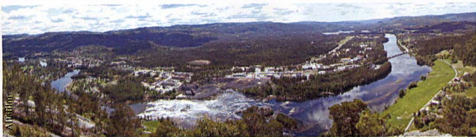
Over t.v. Kirkedøren med Luthers 95 teser og Gutenbergpressen som spredte Ordet ut i verden Under: Sentrale deler av Evje og Hornnes kommune med Otra, Fennefossen hvor haugianerne hadde sitt senter